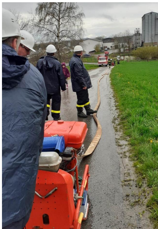
Zkouška dálkové přepravy vody při hasičském cvičení.

ROČNÍK XVII. VYDÁNO: 9. 5. 2023. MĚSÍČNÍK ČÍSLO: 5. Uzávěrka příštího čísla: 24. 5. 2023. Evidenční číslo: MK ČR E 17544. Periodický tisk územního samosprávného celku. Vydává: Obec Oudoleň, Oudoleň 123, 582 24 Oudoleň, IČO: 00267996. DIČ: CZ00267996. Tel.: 569 642 201 773 744 815 obec@oudolen.cz, www.oudolen.cz . Právo na tiskové chyby vyhrazeno.