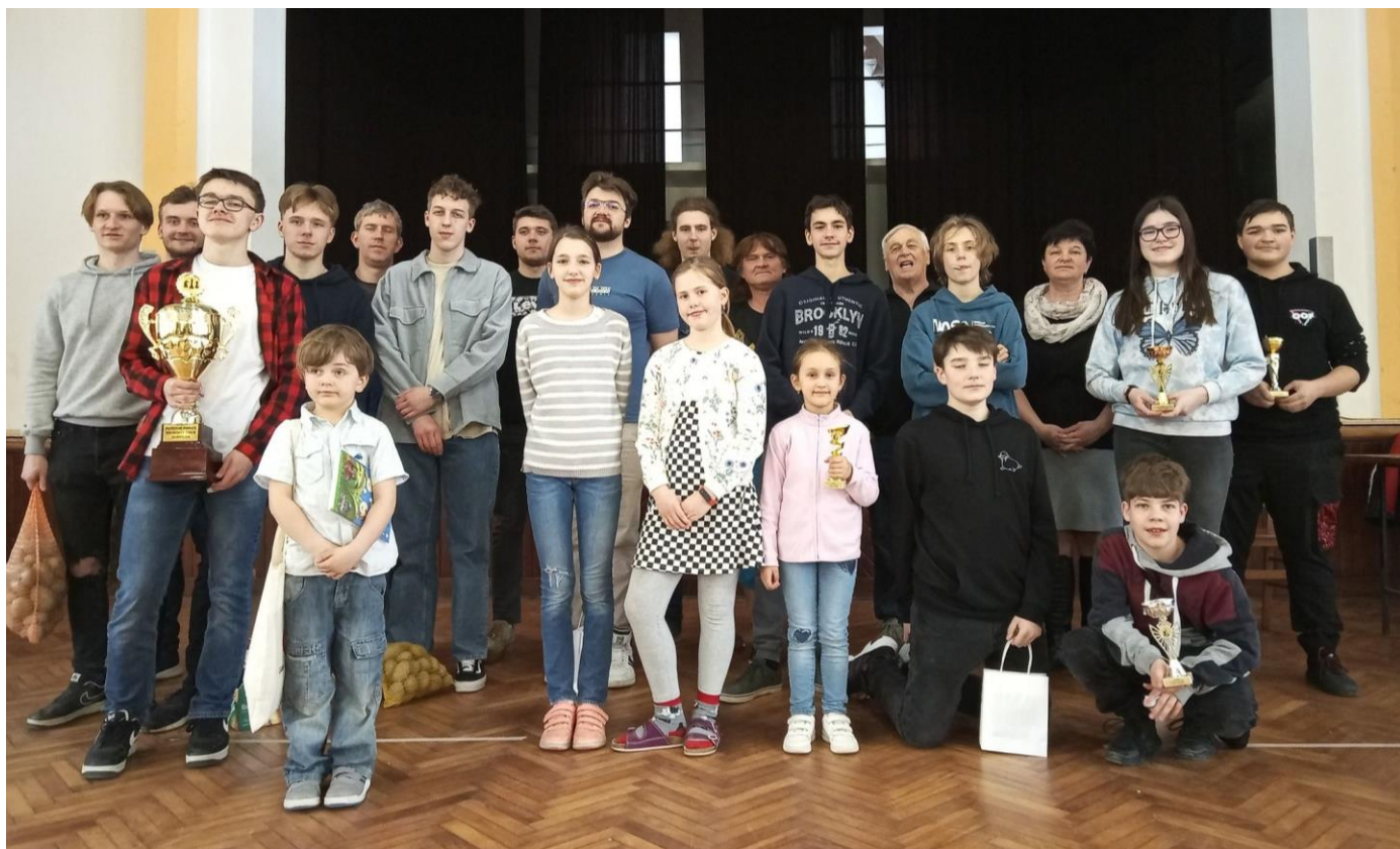
Účastníci šachového turnaje "O pohár starostky".