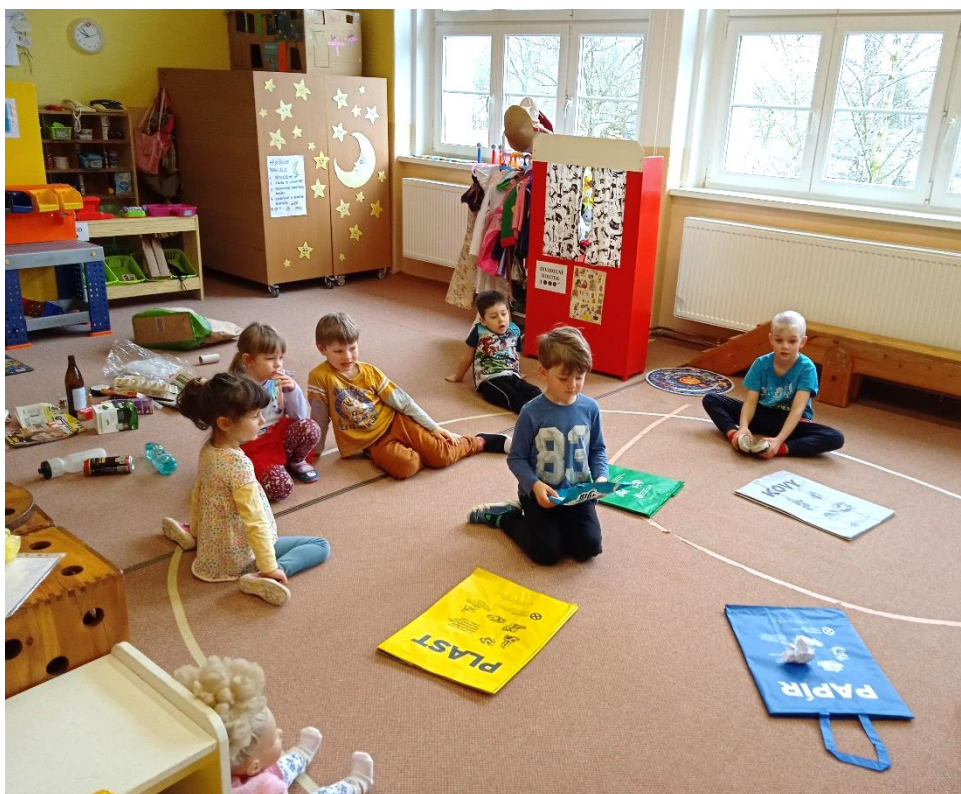
Děti z mateřské školy se učí třídit odpad.