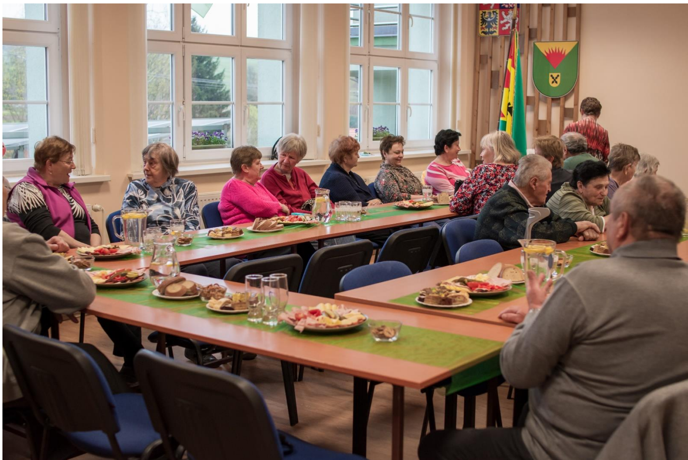
Posezení se seniory.