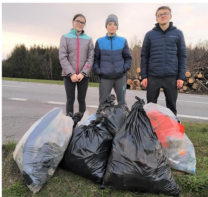
Dobrovolníci při akci Čistá Vysočina.

Protože nám počasí nepřálo, neuklízeli jsme obec a její okolí společně, ale individuálně po skupinkách. Tradičně jsme poklidili okolí silnice k dolní a horní oudolešské křižovatce, silnice na Slavětín a státní silnice směrem na Jitkov a k odbočce na Slavětín. Odpadků se letos zdálo být o něco méně, mezi nejčastější nálezy patřily plastové láhve, skle-